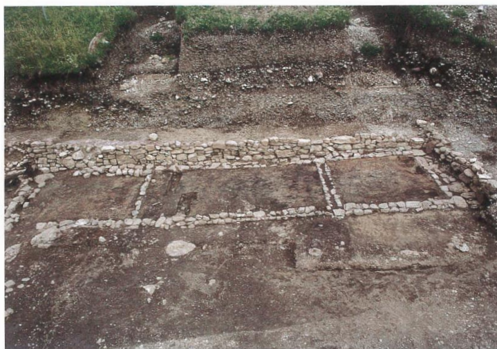
Most na Soči se nam kaže kot eno najpomembnejših središč železnodobne halštatske kulture v Sloveniji z odkritim naseljem in velikim grobiščem na nasprotnem bregu reke Idrijce. V naselju izstopa po svoji velikosti hiša s tremi prostori, ki so bili okrašeni z bogatimi štukaturami iz žgane gline. Priljubljena motiva sta bila spirala in romb.

Tako lahko razdelimo halštatsko kulturo širšega slovenskega prostora na šest regionalnih skupin: dolensko, notranjsko, štajersko, koroško, istrsko in svetolucijsko. Od teh skupin je dolenski krog, ki je bil tudi najgostejše naseljen, v svoji kulturi najvidnejši in najznačilnejši predstavnik jugovzhodne halštatske kulture. Oznaka halštatske kulture, kot je bila v temeljnih potezah orisana za slovenski prostor, velja predvsem za dolensko skupino. Vprašanja etnične pripadnosti nosilcev halštatske kulture na slovenskih tleh so zapletena in v glavnem odprta. Številna nova gradišča na začetku halštatskega obdobja, ki so bila – kot to kaže za Dolenjsko Stična – zasnovana velikopotezno, kažejo na močan priliv novega prebivalstva, ki pa je bilo v kulturnem oziru raznoliko. Dolenjski halštatski krog velja za ilirskega, ta opredelitev pa temelji na povezavi z Glasincem in njegovim kulturnim krogom osrednje-balkanskega prostora, čeprav sam Balkan kot prostor poselitve ilirskih plemen kulturno in etnično ni enoten; med centralnimi in zahodnimi predeli so velike razlike. Prav s slednjimi je bolj povezano območje zahodne Slovenije. Zaradi močne povezave s severnoitalijskim prostorom (Este) bi smeli pri svetolucijski skupini s središčem na Mostu na Soči (nekdanj Sveta Lucija) govoriti tudi o venetski komponenti v njenem etnosu;