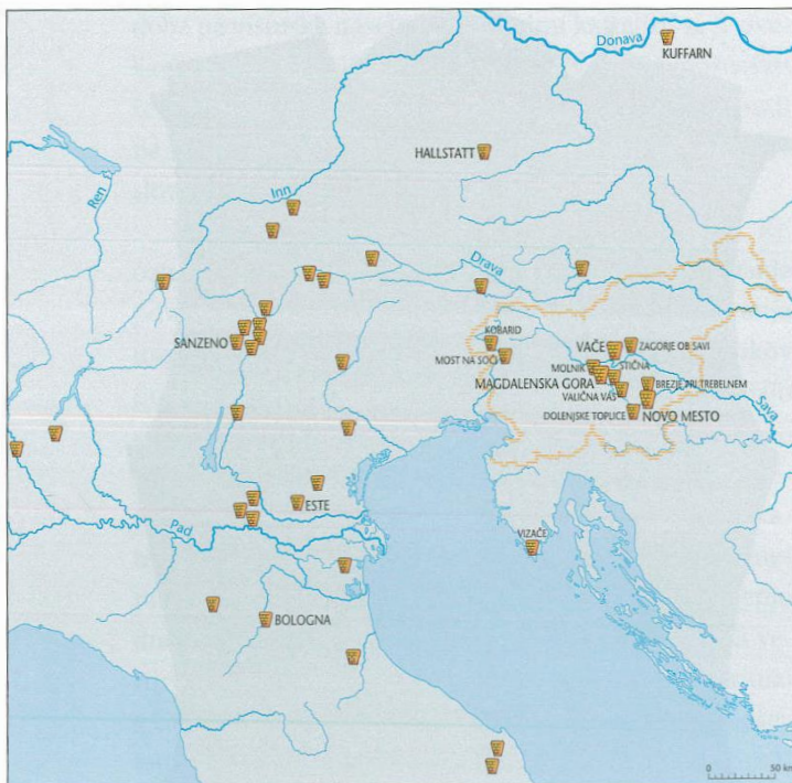
Razprostranjenost situlske umetnosti od 7. do 4. stoletja pr. Kr.

Te na kratko orisane značilnosti označujejo jedrne poteze halštatske kulture v slovenskem prostoru, ki pa – če jo pogledamo od blizu – skriva v svojih pojavih tudi pomembne razlike, še zlasti vidne v načinu pokopa.